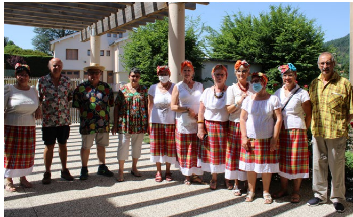
Des airs créoles ont résonné dans la salle de repas pour le bonheur de tous !

Cette journée a permis de chaleureux moments d'échanges et de rencontre entre les résidents, les familles, les amis et tous les acteurs de l'EHPAD (Direction, Cuisiniers, Animatrices et tout le personnel de l'établissement).