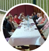
Le repas des aînés