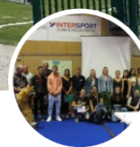
La mise à l'honneur des Beauzacois